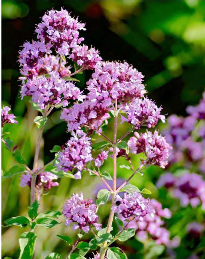
Almindelig Merian (Også værtsplante for sortpletet blåfugl)