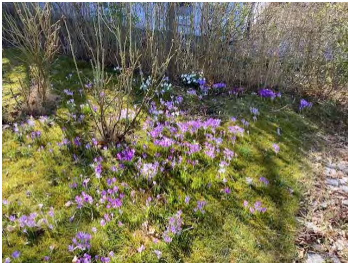
23-09-2022 Krokus i græsplæne-feb 22