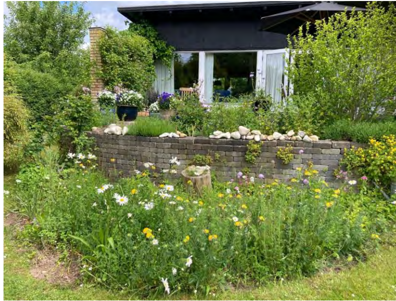
Juni 2022: Hvid og gul okseøj, Klinte, rundbælg, kællingetand, Oregano, Kæmpe verbena, blåhat, musevikke, cikorie.