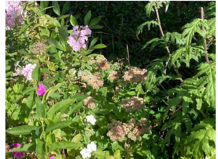
Sept 22. Admiral i Sct. Hans urt