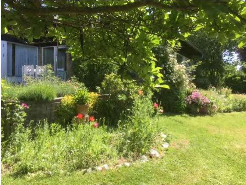
Etablering af særligt insektvenligt bed efterår 2020-Foto: juni 2021: Valmuer, margueritter, kornblomster