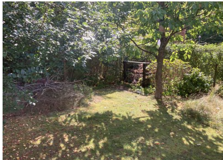
”øer i græsplænen”, kvasbunker, afklippet græs i bede med stauder og roser