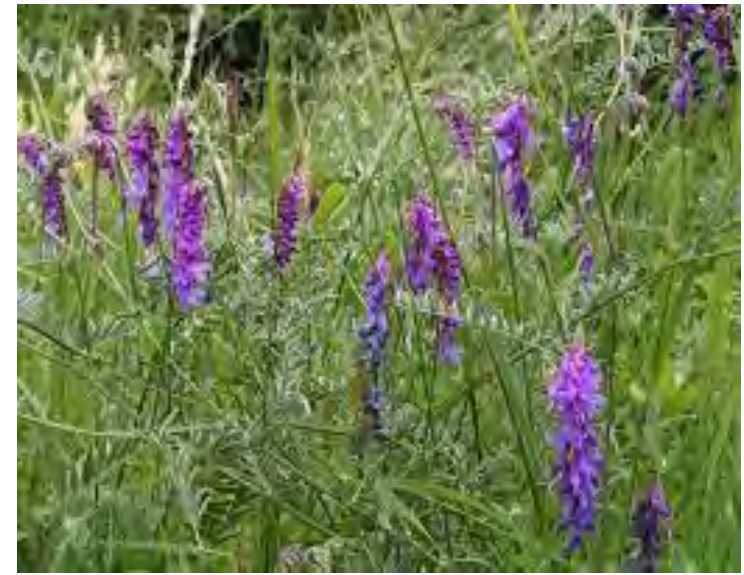
Musevikke (Også værtsplante)