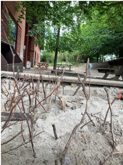
Skov – kreativitet lavet i sandkasse