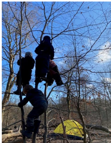
Børnene udforsker egne grænser