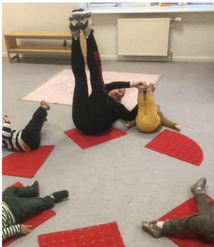
Leg og bevægelse på stuen

Eksempel fra vuggestuen: vi har en bænk stående ved siden af en madras, så børnene altid kan styrke; kraft, afsæt, afstand, retning, timing og udspring, ift deres niveau. Børnene aflurer hinanden og lærer af hinanden.