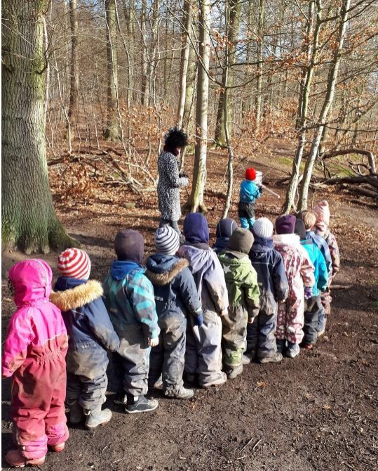
Katten af tønden i skovbørnehaven