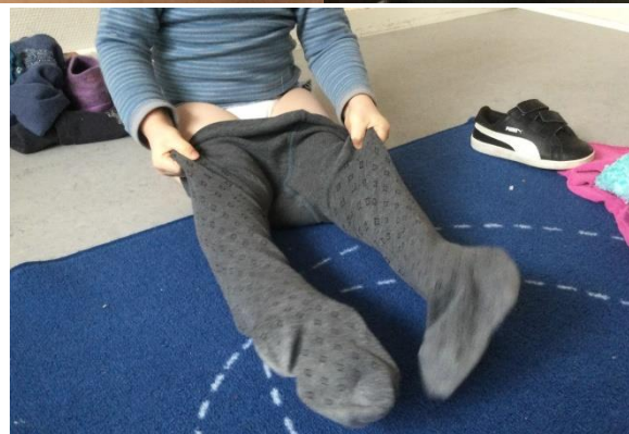
Rutinepædagogikken som læringsrum

I vores pædagogiske praksis, i både vuggestue og skovbørnehave, arbejder vi med at øge kvaliteten af relationerne og samspillet mellem den voksne og barnet, da dette er afgørende ift. at skabe gode og meningsfulde læringsmiljøer. Vi er opmærksomme på, at fokusere på en tryk tilknytning mellem barn og pædagog, reagere sensitivt på barnets behov med omsorg og anerkendelse, have øje for børneperspektivet samt skabe gode rammer for fordybelse og nærvær i vores pædagogiske læringsmiljøer.