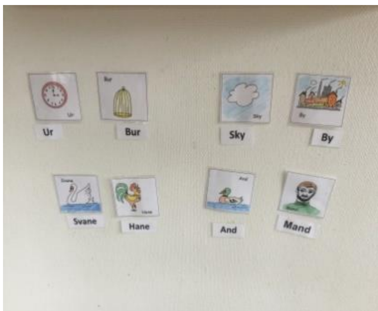
Væg-rim med billeder og skrift.