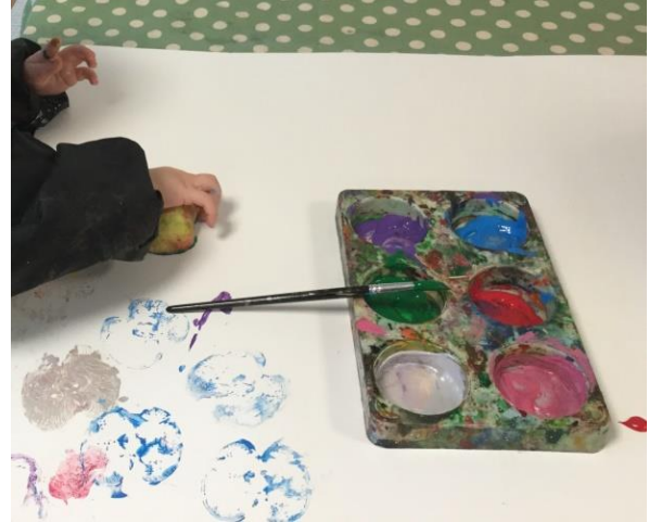
Æbletryk under høstprojektet

Eksempel fra høstfest; I projektugerne op til høstfesten har vi en række pædagogiske aktiviteter, hvor vi forsøger at formidle glæden ved at skabe noget selv. Vi laver bl.a. æbletryk, smager på og undersøger æbler og andet frugt/grønt, maler, limer og snitter og laver billeder og kunst af naturmaterialer og meget andet. På denne måde får børnene udtrykt og afprøvet deres egen kreativitet og observeret andres. Vores udgangspunkt er, at processen er vigtigere end resultatet, men det er også vigtigt at børn øver sig i at afslutte noget de har påbegyndt og samtidigt får mulighed for at vise frem og være glade for og stolte af det de har lavet.