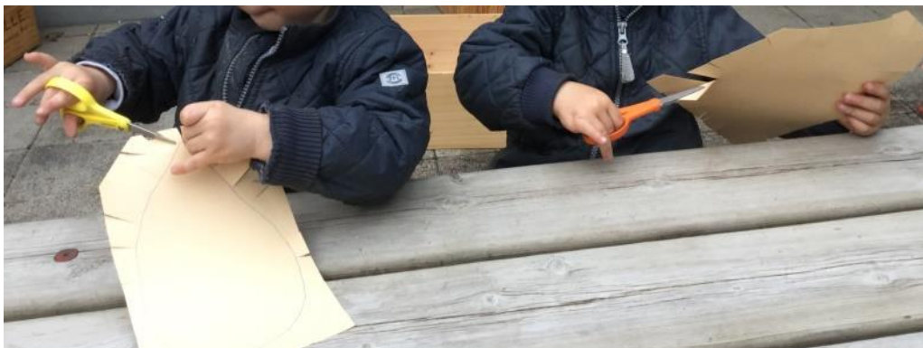
At klippe øver finmotorikken

Børnene styrker og udfordrer finmotorikken gennem; klippe, tegne, at tage tøj af og på, hælde vand op, pakke madkassen ud, konstruktionslege, puslespil, modellervoks, lave perleplader mm. Disse handlinger kan for nogle børn kræve mere koncentration og ro, hvilket vi som voksne er opmærksomme på, og vi hjælper dem ved at rammesætte og skærme dem ved at lave mindre grupper.