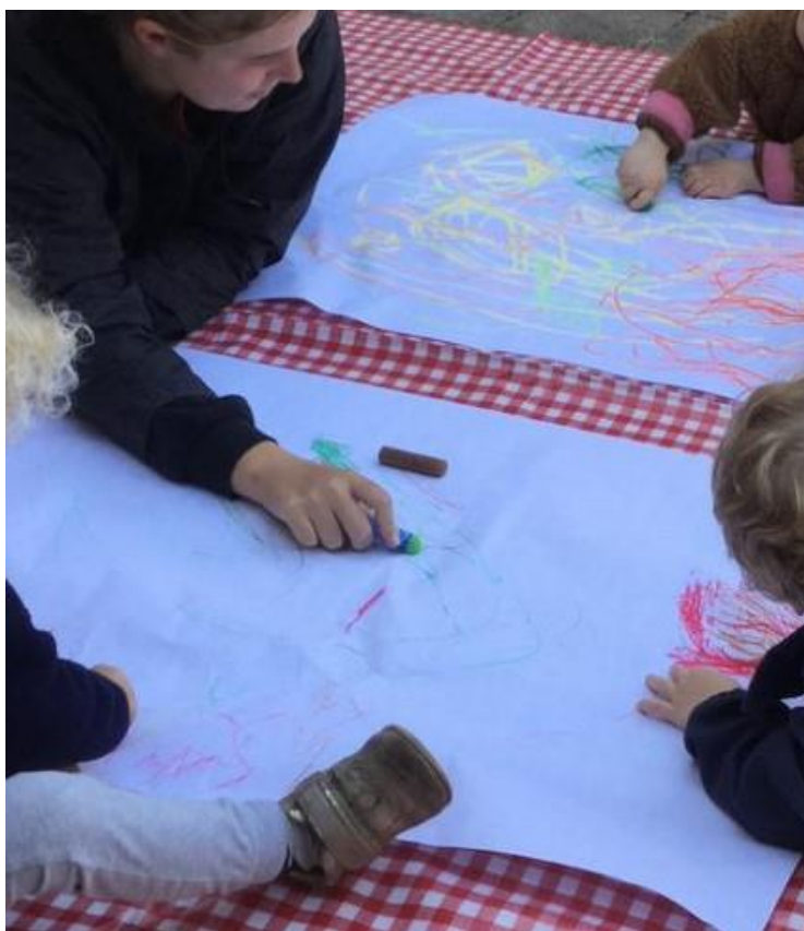
Et læringsmiljø i en lille tegnegruppe

Der ligger uanede lærings- og udviklingsmuligheder i de læringsmiljøer som vi voksne opstiller for børnene. Derfor er det så vigtigt, at vi i Mølleåen er bevidste om hvilken betydning vores tilrettelæggelse af rammer, struktur og organisering har for børnene.