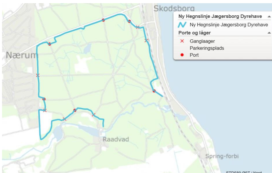
Figur 1. Ny hegnslinje ved udvidelse af Jægersborg Dyrehave (kort: NSTs ansøgning).