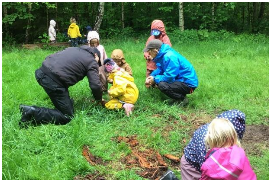
”Fælles fordybelse - Der er noget spændende at undersøge i Bistruphus”

For at skabe sammenhæng mellem dagtilbud og skole arbejder vi med et overgangsprojekt omhandlende natur, udeliv og science. Om efteråret mødes alle de kommende skolebørn til stjerne løb i skoven med fokus på temaer i forskellige eventyr. Om vinteren har alle kommende skolebørn projekt om-handlende større dyr i vinterskoven, dette for at give sammenhæng til når de starter i SFO. Ligeledes har de i foråret projekt om krible krable dyr hvor de mødes med de andre institutioner 4 dage i naturen, her deles børnene i grupper efter hvilken skole de skal starte på, så børnene får set deres kommende klasse kammerater og der er fokus på at skabe relationer. Alt dette arbejder de videre med når de starter i skole/SFO, for at skabe en rød tråd samt gøre overgangen mellem dagtilbud og skole mindre markant.