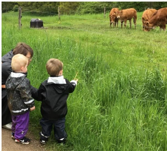
"På opdagelse rundt om "Komarken"

Gåture lige på den anden side af lågen ved "Ko-marken" er meget benyttet af vuggestuen og byder på mange naturoplevelser.