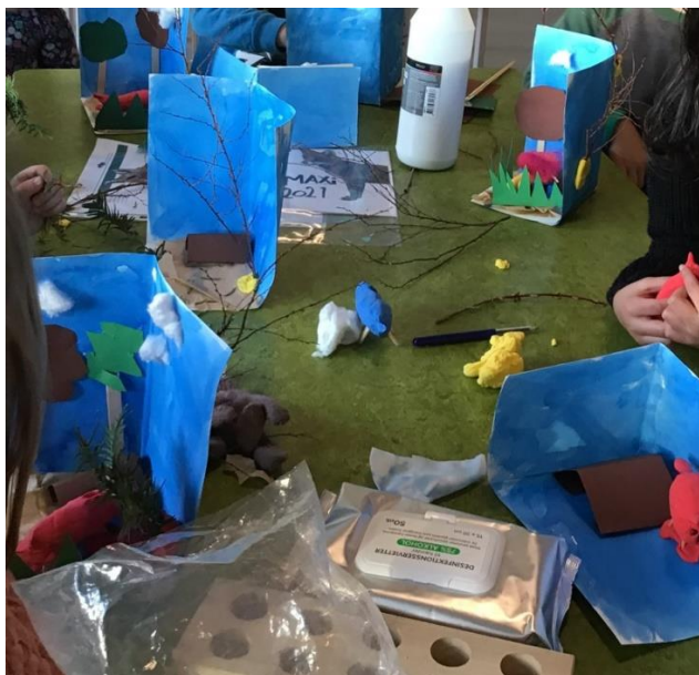
"Børnene arbejder i 3D med tema "Dyr i vinterskoven" (Ræv)

(Det har desværre ikke været muligt at gå til svømning i sæson 2020-2021 grundet restriktioner)