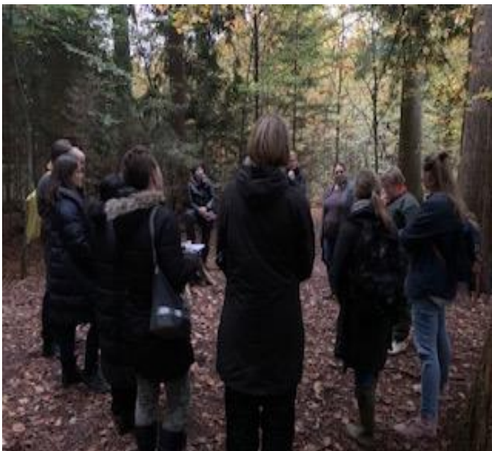
Forældremøde i skoven

Vi arbejder med inddragelse af forældrene i børnenes hverdag. Årets traditioner foregår i skoven, Luciaoptog, afsked med skolebørnene, bedsteforældredag og forældremøde.